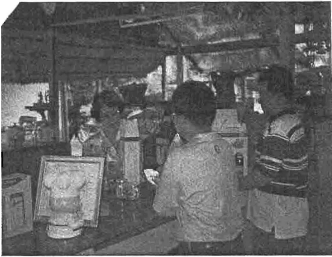
ลูกค้าอุดหนุนไม่ขาดสาย

ผู้ที่อยู่ห่างไกล ถือว่า กระจายดีเป็นพิเศษ อย่างเกษตรกรเผ่าม้งที่ภูหินร่องกล้า ยามปวดท้อง แต่ไม่มียารักษา เขาเคี้ยวหัวกระจายสดๆ แล้วกลืนลงท้อง ก็ช่วยบรรเทาอาการเจ็บปวดได้