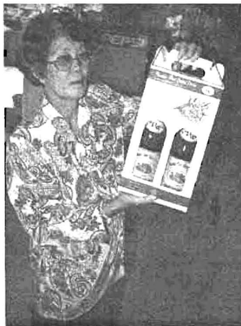
บรรจุกับห่อน้ำชื่อทามก ได้รับ อย และ จีเอ็มพี แล้ว

สาม...ต้มกระจายดี โดยใช้กระจายดี 10 กิโลกรัม น้ำ 20 ลิตร ต้มนานครึ่งชั่วโมง